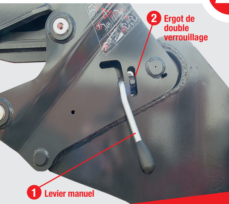
1 Levier manuel